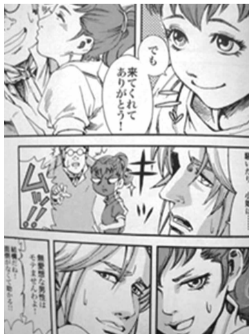
Наташа Ростова. Вы тоже такой ее представляете?