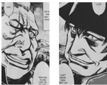
Угадайте, кто это? Правильно, Кутузов и Наполеон.

Японцы, которые давно хотели прочитать русский роман, но спасовали перед его большим объемом, получили возможность прочитать мангу (японский вариант комиксов) по классическому сюжету.