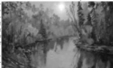
И. Талева. В верхних Ухты.

Многообразие натюрмортов не перестает также удивлять, тут уж все художники постарались, никакой узкой специализации. Благородный жанр и в композиции душу отведешь, и цветом поблудившего от души, и холодными избранными сочными колоритом.