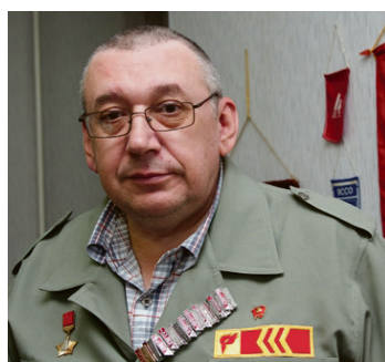
Патриотический клуб Комиссара республики стр. 7