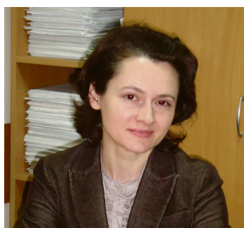
Студенческие отряды - это товарищество, опыт и теплые воспоминания на всю жизнь стр. 6