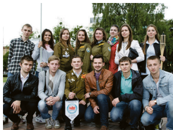
Активное сотрудничество стр. 3