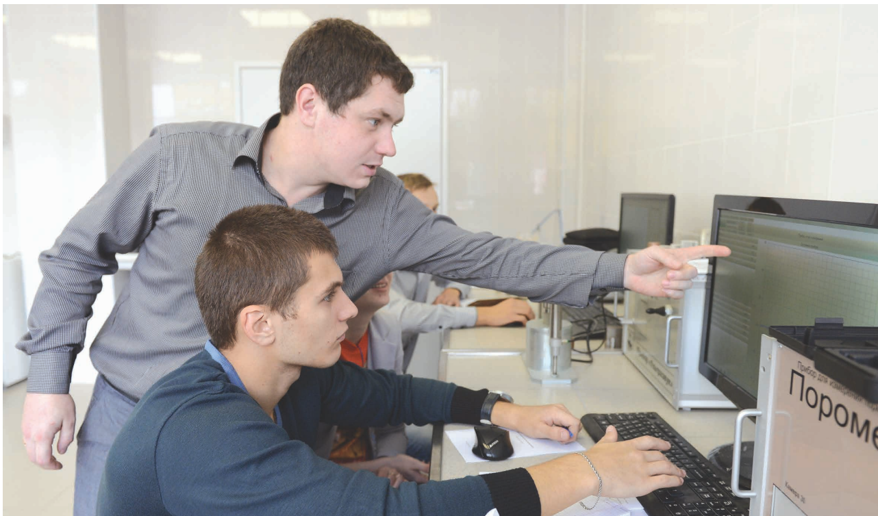
Лаборатория 3D-прототипирования УГТУ.