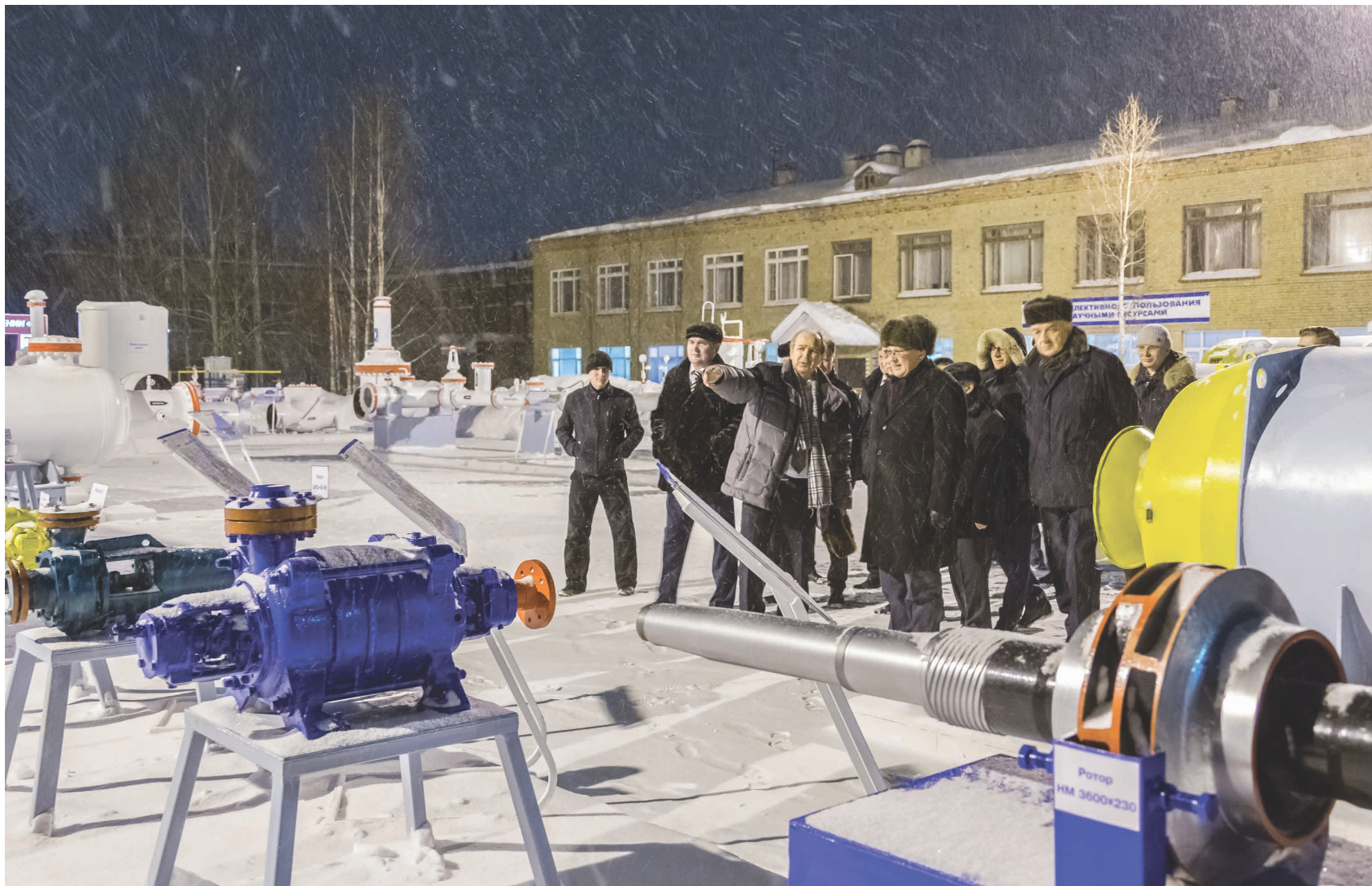
Учебно-практический полигон УГТУ

Еще одна важная составляющая центра — лаборатория 3D-прототипирования. В ней используется техника, которая позволяет создавать полноцветные модели из смеси гипсового порошка и специальной жидкости. Есть также принтеры, которые в качестве материала используют специальные пластики. Кроме простых принтеров лаборатория оснащена системами атмосферного и вакуумного литья. В лаборатории студенты обучаются работе с 3D-технологиями. Отрасль перспективная, и навыки работы с 3D-печатью будущим «технарям» производства весьма полезны. А для региона это станет средством решения ряда производственных задач, например, по технологии стереолитографии.